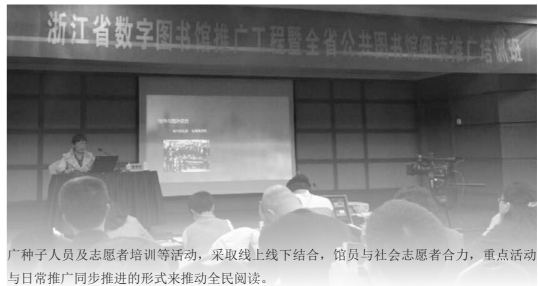
广种子人员及志愿者培训等活动，采取线上线下结合，馆员与社会志愿者合力，重点活动与日常推广同步推进的形式来推动全民阅读。

培训期间，十一家市级馆交流了各地区2016年全家共读一本书活动开展情况，并讨论了2017年全省读者推广活动计划。2017年，浙江省公共图书馆将以全民阅读主题活动为中心，协调全省公共图书馆联动开展图书馆之夜、未成年人读书节、书香进礼堂、阅读推