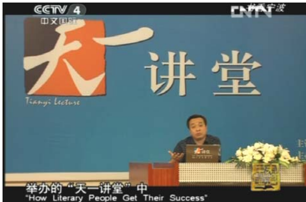
宁波市图书馆“天一讲堂”受到听众追捧

为拍摄《书香宁波》,央视提前一个月就在宁波进行了踩点,并邀请了宁波文化学者进行了咨询策划,选取了最能反映宁波浓厚读书氛围的事例,进行深入采访拍摄。