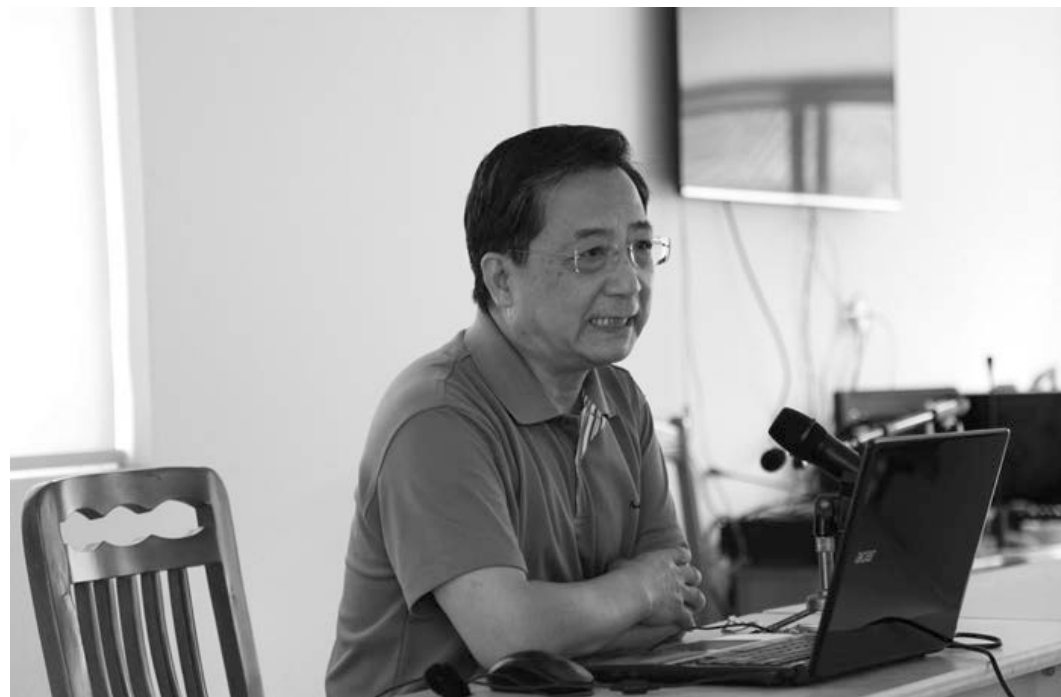
北仑区大碇镇青林村

9 月 24 日上午，宁波市图书馆举办的“百名回乡教授”走进文化礼堂活动，在北仑区大碇镇青林村举行。市图书馆结合讲题情况，从报名的乡贤中，选请了於贤德教授，为村民带来《生活的美学——日常生活美的创造与欣赏》的讲座。於教授是哲学博士，浙江万里学院文化与传播学院院长，广东外语外贸大学二级教授，主要从事文艺美学、城市与桥梁美学、传播文化学的教学与研究，出版有《民族审美心理学》《电视审美文化研究》《景观美》《中国桥梁》《城市美学》《节目主持人的策划与创新》等专著 6 部，发表论文 120 多篇。更为重要的是，於教授是土生土长的北仑大碇人，回到