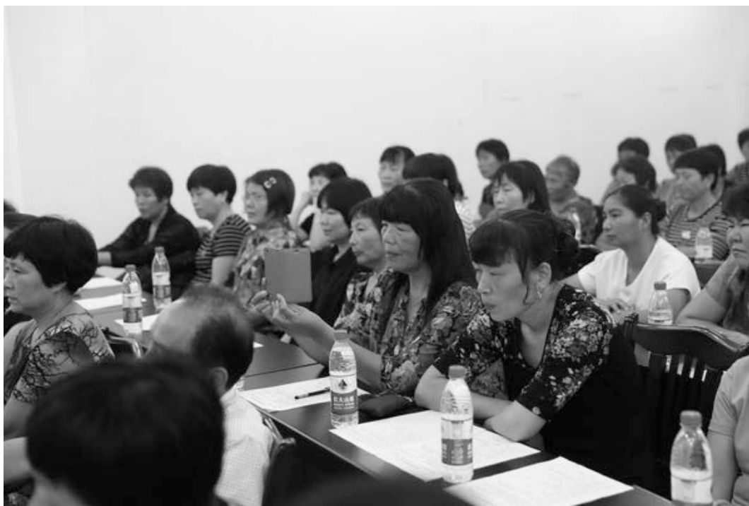
象山县黄避岙乡龙屿村

“把美的追求作为生命的‘绝对命令’，把自己的聪明智慧、意志情感、想象联想和技艺技能最大限度地调动起来投入到生活中去，投入到审美活动中去。那么，我们的生活就会变得更加美好，我们的人生就能进入美轮美奂的审美境界。”最后，於教授鼓励乡亲们在生活中继续追求美，欣赏美，创造美。