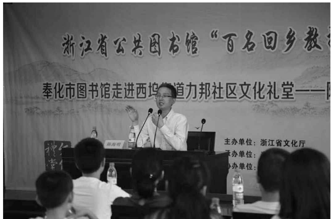
奉化西坞街道力邦社区

活动现场，何教授把这一生的所做所见所闻用简单朴实的话语、生动详实的案例与村民们进行了分享，用自己的生活经验来阐述如何建设和谐的家庭及建设和谐家庭的意义。