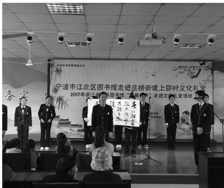
江北区图书馆走进庄桥街道上邵村文化礼堂