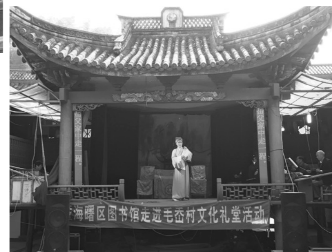
海曙区图书馆走进毛岙村文化礼堂