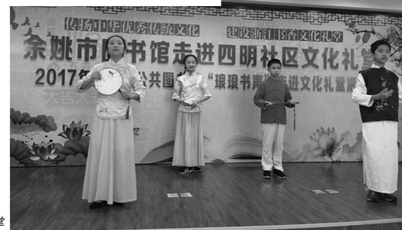
余姚市图书馆走进四明社区文化礼堂