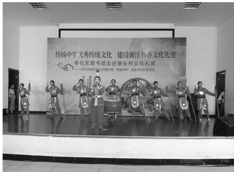
奉化区图书馆走进滕头村文化礼堂