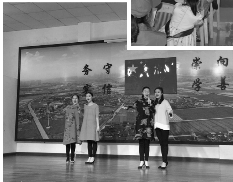
鄞州区图书馆走进陈介桥村文化礼堂