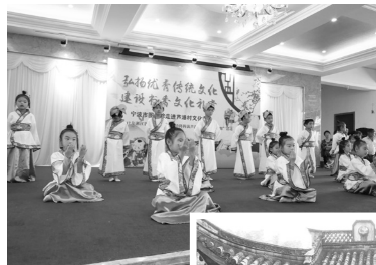
宁波市图书馆走进芦港村文化礼堂