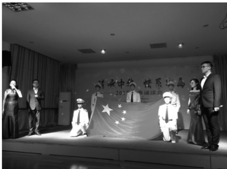
象山县图书馆走进西周镇陈隘村文化礼堂