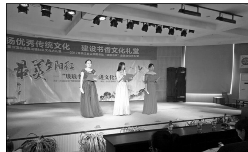
北仑图书馆走进高河塘文化礼堂