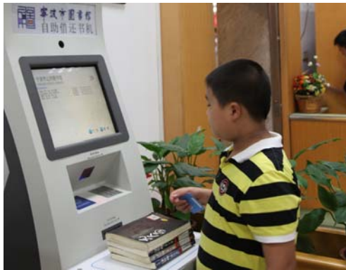
读者在宁波市图书馆外借室体验自助借还。

“24 小时自助图书馆将为市民提供个性化服务。目前宁波市图书馆的 60 余万册图书已经进行了智能化加工，每天的图书量还在不断增长中。宁波市图书馆内已实现了读者自助借还图书。这 60 多万册图书将为分布街区的 24 小时自助图书馆提供资源保障。”市文广局相关负责人昨日介绍，“下一步，全市 150 个公共图书馆将在一卡通的基础上进行逐步智能化提升，通过几年时间，为打造智慧文化提供信息化平台。届时，