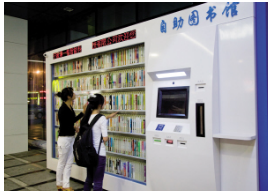
位于联盛广场的 24 小时自助图书馆倍受关注。

据悉，我市年内将建设 10 座 24 小时自助图书馆，“各企事业单位、生活小区可向市文化主管部门申请开设 24 小时自助图书馆项目。”【来源：宁波日报 作者：陈青/文、周建平/摄 发布日期：2012-09-07】