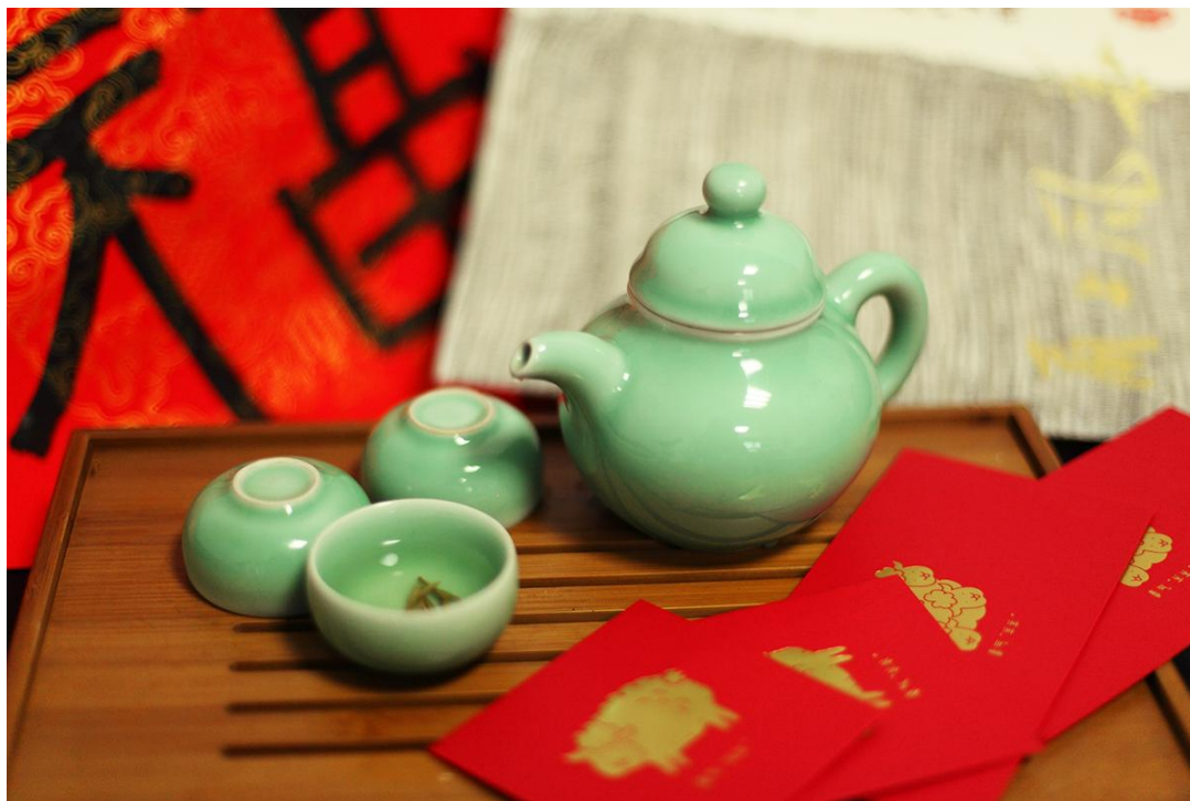
(作品名：三代人的年味儿)