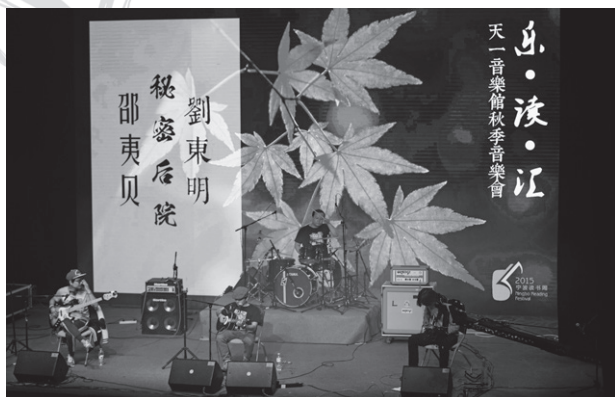
天一音乐馆“秋季音乐会”

一种较为私人的体验转变为一种共享式的体验，即书友之间面对面的分享互动交流。包括阅读分享、名家约读、作品分享、主题讨论等多种形式。在阅读周期间推出名家约读，邀请著名学者、传记作家止庵举行作品分享会，通过市民对日本樱花与枫叶的了解，解读日本人的文化性格和中国传统文化对其的影响。