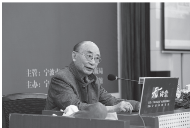
著名连环画家贺友直

2015宁波读书周期间，宁波市图书馆举办“连艺芬芳——中华连环画史话暨优秀获奖作品展”活动，值得一提的是，我国著名连环画家贺友直先生的《山间巨变》等代表作品也在本次展览中与市民见面。11月1日上午，贺老作客天一讲堂，向广大连环画爱好者讲述“连环画里的世界”。在五十多年的连环画创作生涯中，贺老总结出了一生受用的至理名言：“从生活中捕捉感觉，从传统中寻找语言，从创作实践中发现自己。”在这三条创作规律中，他认为最重要的还是发现自己、明白自己。“一个搞创作的人应该对自己有个分析和研究，明白自己对生活和艺术的哪些方面感兴趣，或者是偏好，将生活与艺术的偏好相结合，也许能走出一条自己的创作道路。”讲座接近尾声，贺老告诫在场的听众特别是青年艺术创作者们，