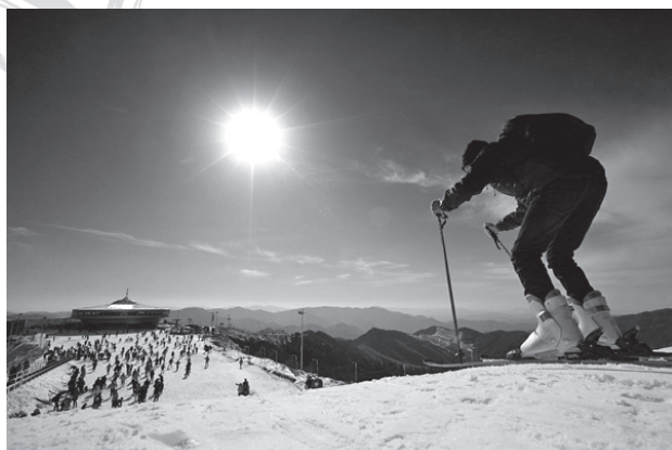
《激情雪世界》(黄友平摄)

大赛得到了摄影师们的积极响应，共收到 1200 幅摄影作品，摄影师们采用独特艺术视角和摄影技法展现当代宁波的城市风采。