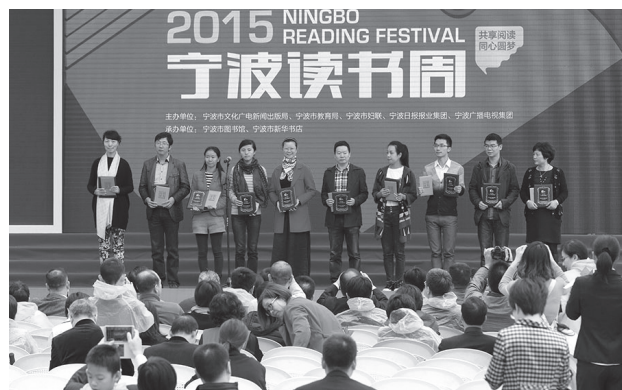
2015 宁波市“十佳阅读家庭”获得表彰

倡导全民阅读，建设书香社会，不仅需要提供更多优秀的作品，更重要的是层层引领广泛推动，让全民阅读真正形成一种无处不在的氛围，让读好书、好