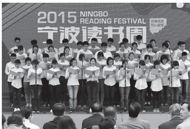
青年学生代表集体诵读经典之作《论语》

读书成为市民自觉的生活方式。今天开幕式上，我市青年学生代表组成的朗诵队集体诵读经典之作《论语》中拉开序幕。阅读，无处不在，每个人都能在潜移默化中感受到阅读带来的力量。