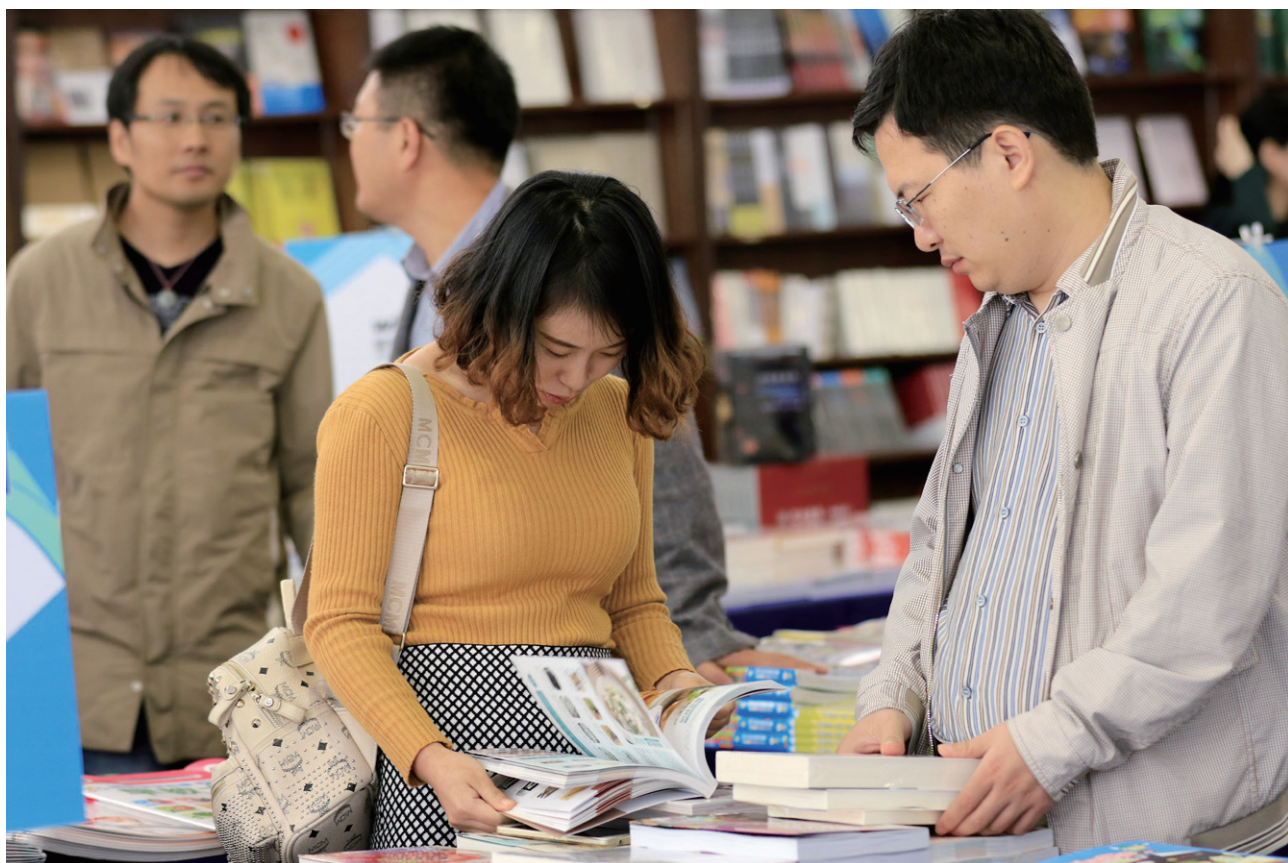
2015 宁波读书周·宁波书展现场