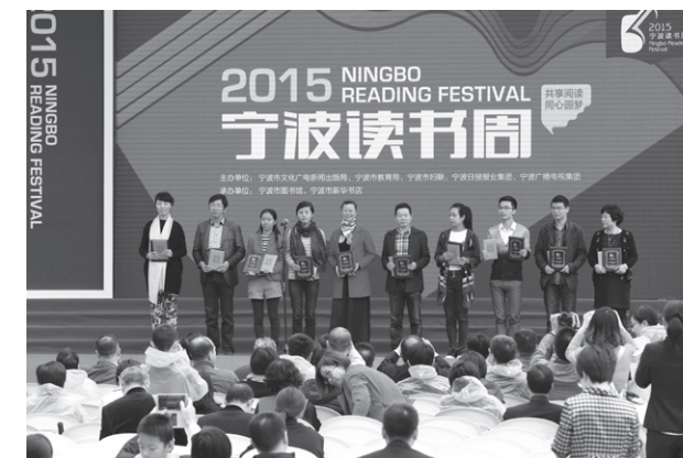
“十佳阅读家庭”颁奖

最美空间 阅读典型 在我们身边，既有给读者知识、信心、智慧、力量的公共阅读空间——公共图书馆，也有老百姓身边的社区里的阅读之家——社区图书馆，还有培养孩子阅读习惯的个性童书馆——绘本馆，以及融茶书道、文化讲座于一体的社会公益阅读空间——民营书店、咖啡书店、书吧餐厅等等，这些独具文化特色的阅读空间既提供了自由娴雅的读书环境，又使市民的文化素养有所提升。值得一提的是社会公益阅读空间将社会公众服务和文化遗产的理念引入到经营之中，创新经营模式，在实现自我价值同